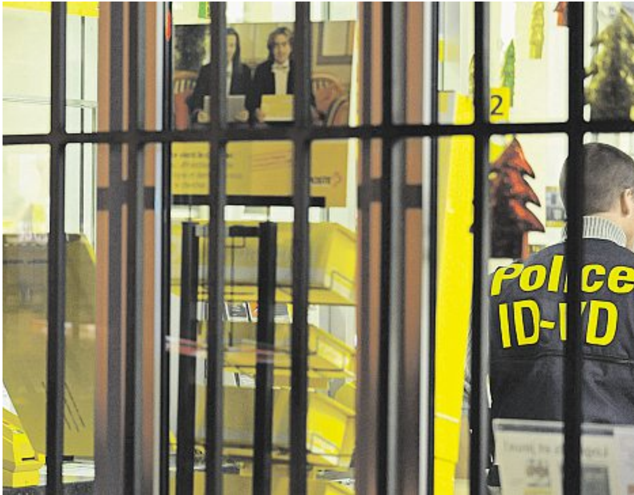
Una decina di poliziotti con dei cani segugio sono intervenuti prontamente dopo la rapina in un ufficio postale.